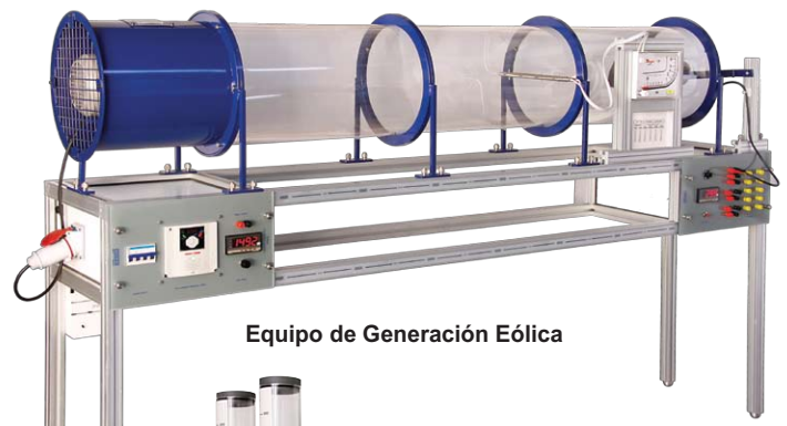
Equipo de Generación Eólica