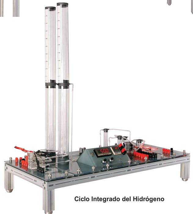
Ciclo Integrado del Hidrógeno