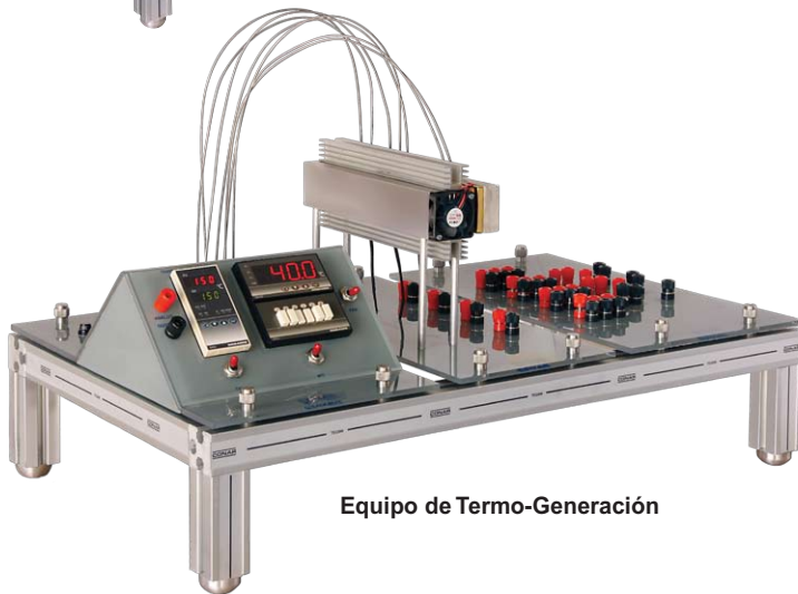
Equipo de Termo-Generación